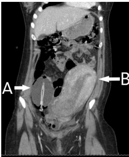
Figura 1 TC de abdomen y pelvis que muestra el globo (A) adyacente al útero (B)

Una mujer de 18 años acudió de un hospital externo 12 horas después de un parto vaginal complicado por hemorragia posparto, que se había manejado con uterotónicos, dilatación y legrado, y colocación de un balón de Bakri seguido de taponamiento vaginal. A su llegada, los signos vitales del paciente estaban dentro de los límites normales; sin embargo, se quejó de un fuerte dolor abdominal bajo. Se palpó el fondo de ojo en el cuadrante inferior izquierdo y se palpó una masa firme en el cuadrante inferior derecho. Una tomografía computarizada abdominal mostró el balón de Bakri ( Figura 1 , A) y su punta en el cuadrante inferior derecho del abdomen fuera del útero ( Figura 1 , B). Se realizó laparotomía exploradora y se visualizó el balón de Bakri dentro del ligamento ancho derecho ( Figura 2 ). El globo se desinfló y se retiró bajo visualización. No se identificaron lesiones internas. El paciente tuvo un curso de recuperación postoperatorio sin incidentes. Las instrucciones del fabricante recomiendan la confirmación de la colocación correcta de Bakri mediante ultrasonido.