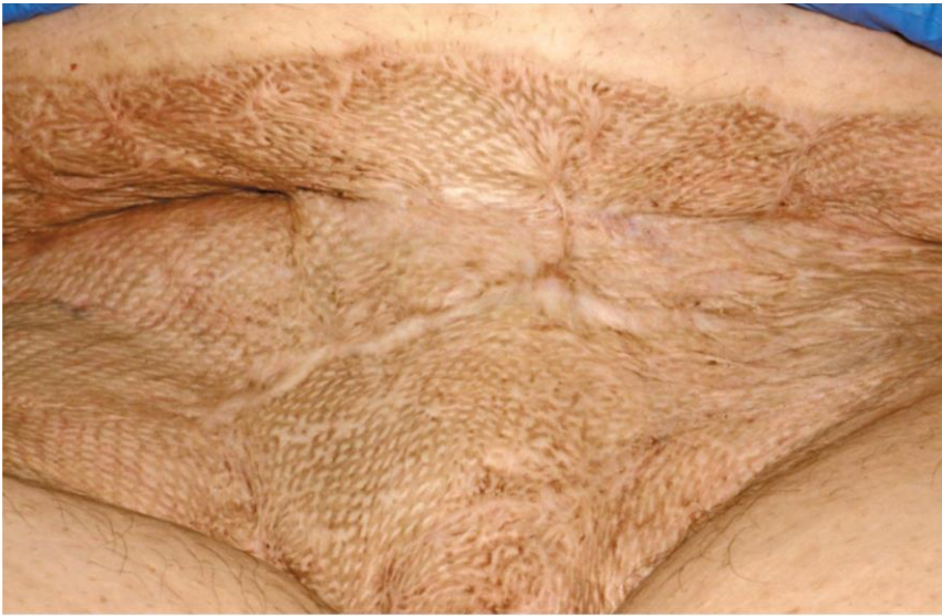
FIGURE 3 Healed vulva and abdomen in a patient with a history of stage 3 HS, 1 year out from surgery (vulvectomy, abdomen and buttock resection with skin grafting).

Para el estadio 3 o HS grave, se recomienda la escisión radical amplia con injerto de piel para el tratamiento definitivo (Figura 3).