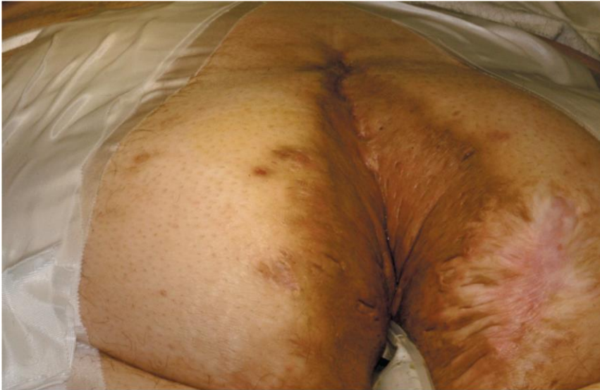
FIGURE 2 Patient with stage 3 hidradenitis suppurativa of the buttock, vulva, and abdomen, in prone position to undergo resection. After resection, the patient is rotated to lithotomy position for further resection.

Finalmente, la etapa más grave es la etapa 3, que consiste en enfermedad difusa con múltiples vías conectadas, túneles y cicatrices significativas. 1 (Figura 2)